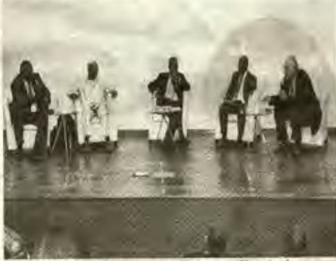
L'Eléphant Vert veut révolutionner l'agriculture ivoirienne

Le forum sur l'agriculture a eu lieu les 13 et 14 octobre à Abidjan. Au cours de cette